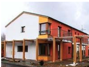
V satelitním městečku na okraji Ostravy by senioři měli bydlet od června. Kolik je zájemců, však radnice nechce sdělit » větší obrázek

Ostrava - Na okraji lesa poblíž Ostravy jsou ještě v dohledu panelové domy nedalekého sídliště. Tady však vyrostlo něco úplně jiného. Louka na periferii ostravské části Poruba se přeměnila v satelitní městečko, které nemá v Česku obdoby.