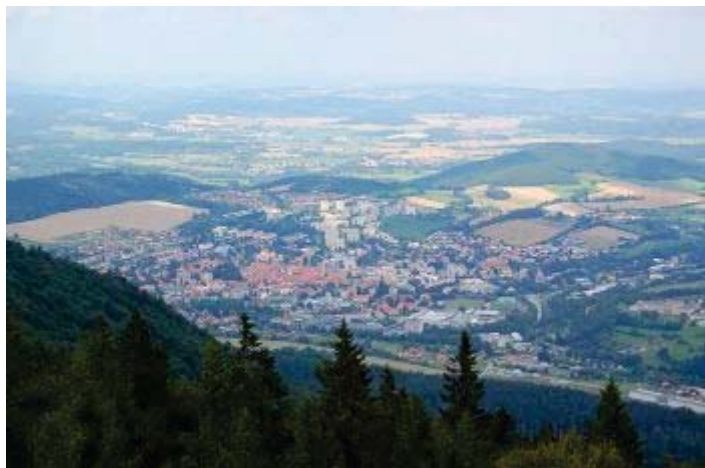
Pohled na Prachatice z rozhledny na hoře Libín.

PRAHA (Ekolist) - Suburbanizace není v našich podmínkách nic nového. Objevuje se v české krajině už od konce 19. století. Na konferenci s názvem Krajina města - město v krajině se kromě suburbanizace hovořilo i o vlivu krajinného rázu na genius loci města. Konferenci pořádal Historický ústav Akademie věd ČR společně s geografickou sekcí Přírodovědecké fakulty Univerzity Karlovy v lednu letošního roku.