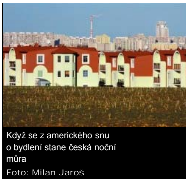
Když se z amerického snu o bydlení stane česká noční můra

Svým charakterem satelity připomínají favely, jen v nich není tolik legrace: narychlo postavené domy uprostřed ničeho totiž většinu dne zejí prázdnotou. Zatímco ještě před lety se považovaly za pomstu movitějších s vekslačským vkusem, dnes se na stejná místa stěhuje střední třída ze sídlišť s podobným vkusem, jen bez rychlých milionů z Pitrových druhokostních mandarínek. Z domů se proto stávají byty, ubývá věžiček a téměř zmizely zahrady. Také se jde stále dál od města, celkem jedno kam. Umožňují to levnější hypotéky, leasingy a půjčky na cokoli. Chudší lidé se kvůli americkému snu po česku, kdy vám soused vidí nejen do bazény, ale i do ložnice, zadlužují za pozemky, za domy, za auta i za