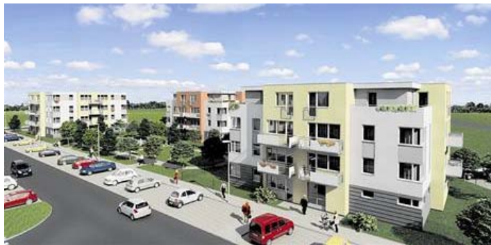
Jesenice u Prahy II. Developer prodává ve 2. etapě projektu byty 2+kk a 3+kk

Jeden z bytových projektů, který je zacílen na mladé lidi, připravila v Jesenici u Prahy developerská společnost Bemett. Ceny bytů se tu pohybují od 33 000 do 39 600 korun za metr čtvereční.