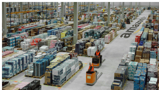
Distribuční sklad Amazonu v Německu